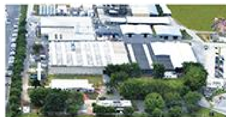
Viapol - Unidade Caçapava

Fundada em 1990, a Viapol tem um portfólio com mais de 900 itens direcionados a proteção, conservação e valorização de obras, além de suprir demandas da indústria de transformação. Os produtos são desenvolvidos para atender com eficiência a todas as etapas de um empreendimento, da fundação ao acabamento.